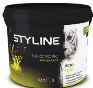
Produkt: Acro Style Matt