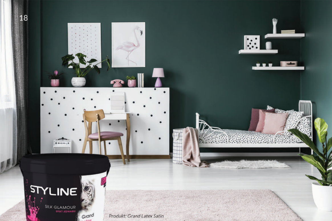
Produkt: Grand Latex Satin