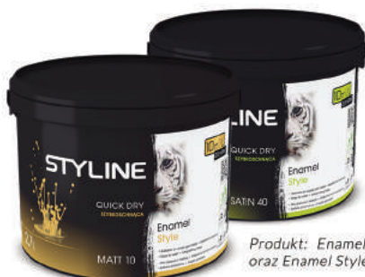
Produkt: Enamel Style Matt oraz Enamel Style Satin

Polecamy pięć odcieni, które nadadzą Twoim meblom nowego życia, idealnie wkomponują się do każdego stylu pokoju i przez kolejne lata będą cieszyły Twoje oko! Eleganckie kolory stworzą klimat który ma niezwykłą moc. Ulotne chwile zatrzymają się, a Ty powrócisz do wspomnień i niezapomnianych momentów związanych z meblem.