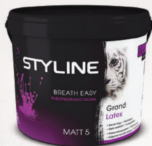
Produkt: Grand Latex Matt