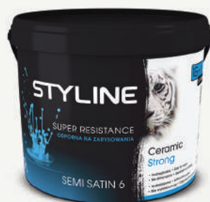
Produkt: Ceramic Strong Semi Satin

Nieduże pomieszczenia zaleca się pomalować na ciepłe, pastelowe odcienie. W małych sypialniach należy unikać ciemnych płaszczyzn. Rozświetlenie w pokoju nadadzą barwy słoneczne, np. odcienie żółtego. Ciemne płaszczyzny idealnie sprawdzą się przy większych pomieszczeniach, nadadzą im głębi oraz tajemniczości.