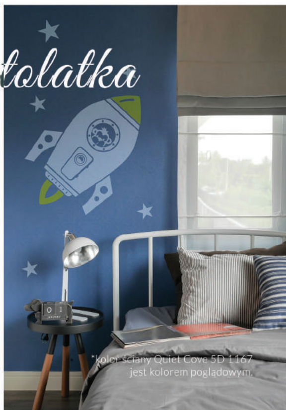
*kolor ściany Quiet Cove 5D 1167 jest kolorem poglądowym.

Wybierając ciemne oraz głębokie kolory ścian, pamiętaj, aby rozjaśnić pokój jasnymi dodatkami do wnętrza. Nie jest prawdą, że ciemne kolory nadają przygnębiającej atmosfery, przeciwnie! Głębokie kolory podkreślają moc dodatków oraz tworzą wyjątkowy klimat przenoszący nas w niezwykły świat.